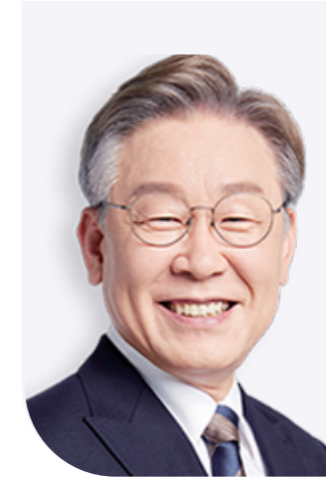
이재명펀드 2022 대통령 후보