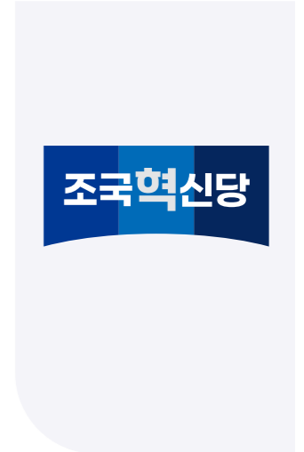
파란불꽃펀드 2024 국회의원 비례대표