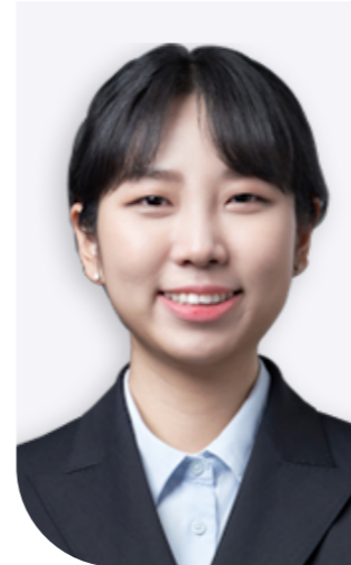
우서영펀드 2024 국회의원 후보